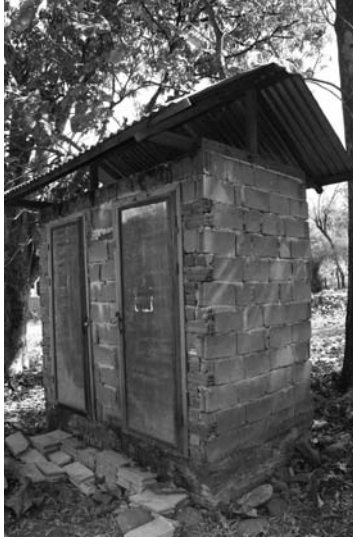
Projet d'agrandissement des toilettes

Nous vous demanderons votre aide pour des actions ponctuelles et surtout collectives, nous fournirons à nos adhérents tous les renseignements techniques utiles.