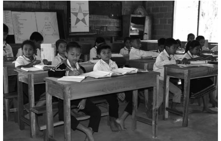
Les enfants de l'école de HOUY YANGKHAM

Tous vos dons seront utiles pour terminer et aménager l'école.